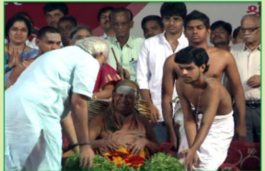
Visit to Ganga Sagar 20.06.2012