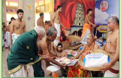
Meet with Narendra Modi