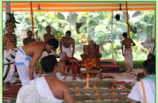
Visit to Haridwar 14.06.2012